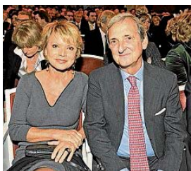
Engagieren sich für benachteiligte Kinder: Uschi Glas und Dieter Herrmann