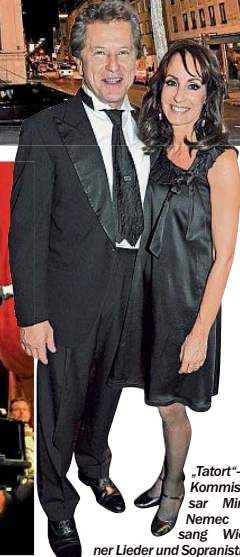
„Tatort“-Kommissar Miro Nemeč sang Wiener Lieder und Sopranistin Anna-Maria Kaufmann Songs von Leonard Cohen